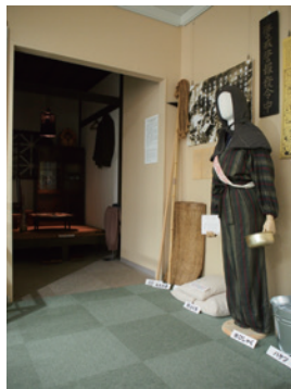
▲空襲への備え(再現展示) ◀体験記録・被災写真・被災品の展示

東京大空襲・戦災資料センターは民間の学術研究機関である公益財団法人政治経済研究所の付属博物館で、2002年3月9日に開館しました。センターの目的は東京大空襲をはじめとする空襲や戦争による一般民間人の被害の実相を明らかにし、それを伝えていくことにあります。そのことを通して、二度と戦争の惨禍を繰り返さず、平和な世界を築くことに貢献したいと願い、常設展示をはじめ調査研究事業、空襲体験記などの刊行、講演会やシンポジウムの開催など様々な事業を行っています。