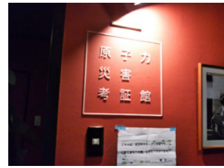
▲原子力災害考証館

原子力災害考証館は、いわき湯本の旅館「古滝屋」の9階の一室にあります。災害の被害・原因・解決のための取組を体系的に整理しながら、草の根の人びとが取り組んできた軌跡(測定、対話、伝承、裁判、人材育成等)や、原子力政策が有する課題などを幅広く扱う展示ルームです。「原子力災害による未曾有の被害は、社会の根底的な価値観さえ揺るがすものでした。先祖代々守り続けてきた大地。どこにも負けないくらい豊かな海。暮らしに根付いた文化。日々の暮らし。そうしたものの、ささやかな信頼と誇り。様々な、形あるもの、ないものが壊され、失われました。何が被害を深刻化させたのか。私たちは何を失い、何に気づき、何を取り戻さねばならないのか。命の営みにとって本当に大切なものは何か。それを二度と失わないようにするために、どのような社会にしていけばよいのか。そうした一つひとつの問いに、向き合える場所をつくりたい(考証館設立趣旨より抜粋)」そんな思いが込められています。