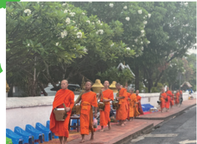
▲托鉢の様子(人口の9割が仏教徒)