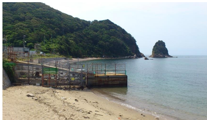
上関原発建設予定地