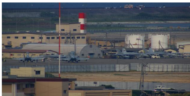
駐機場に並ぶFA18ホ－ネット

超過手荷物料金 クリーニング代、電報・電話代、心づけ、追加飲食等の個人的性質の諸費用 お二人部屋希望の場合の追加料金 7,500円 (2泊分、お一人様) 集合・解散地までの交通費・宿泊費 傷害、疾病等に関する医療費、任意の旅行傷害保険料