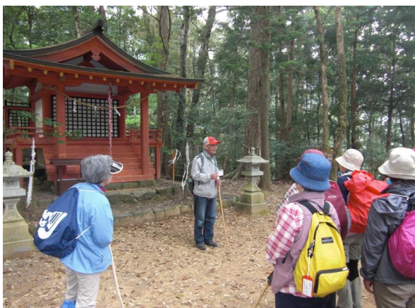
地元の語り部がご案内