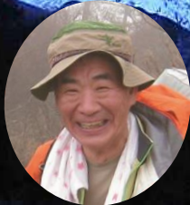
元NHKエグゼクティブアナウンサー