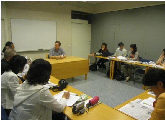
▲教育についてレクチャー（イメージ）