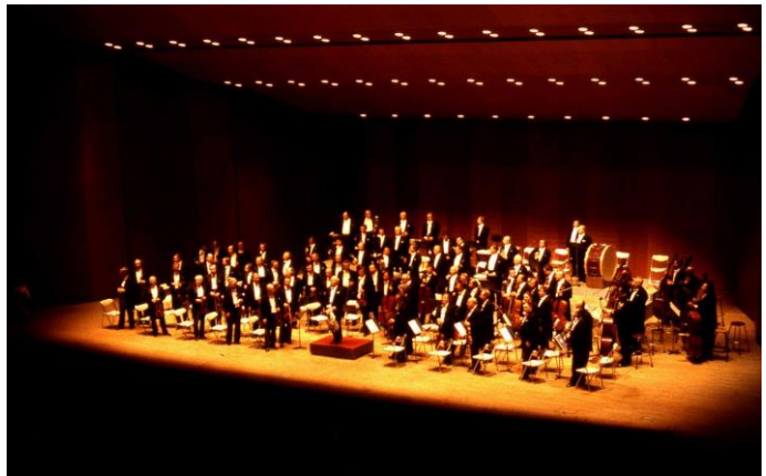
チェコ・フィルハーモニーオーケストラ