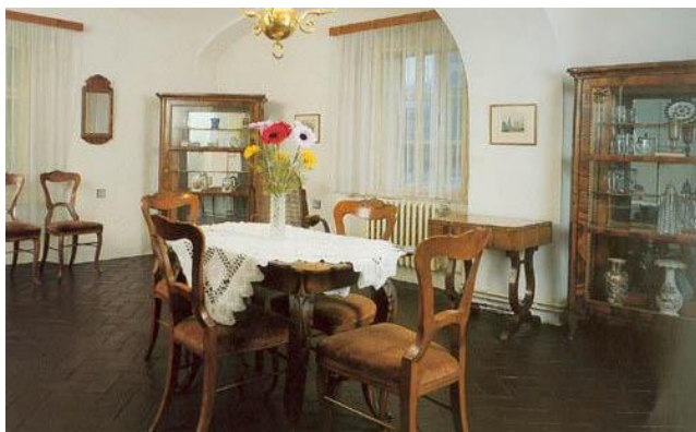
ドヴォルザークの生家