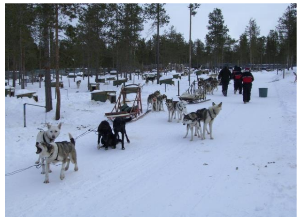
犬ぞり体験(オプション)