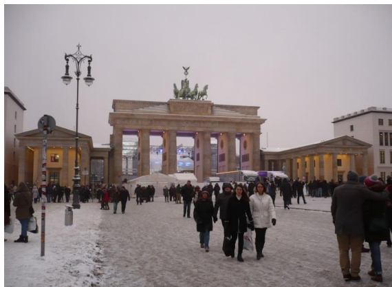
ブランテンブルク門(ベルリン)