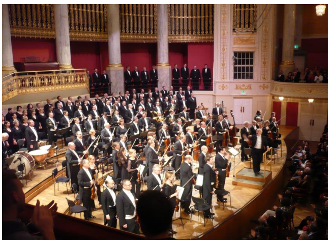
コンツェルトハウス(ウィーン)