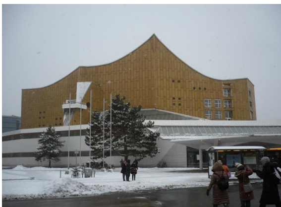
コンサートホール・フィルハーモニー(ベルリン)