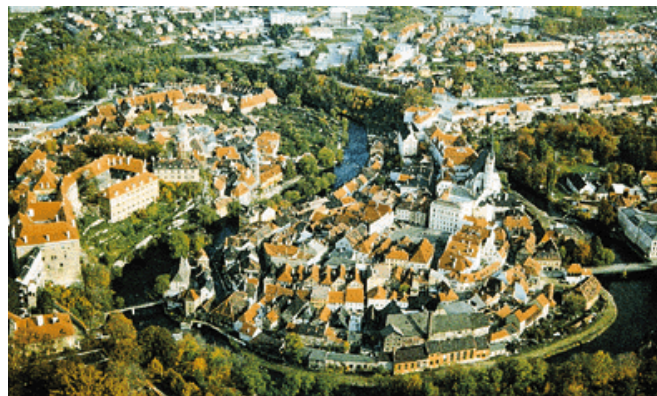
チェスキークルムロフ