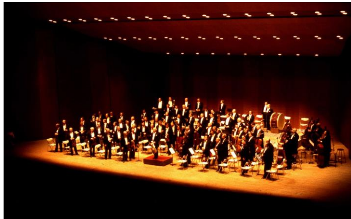
チェコ・フィルハーモニーオーケストラ