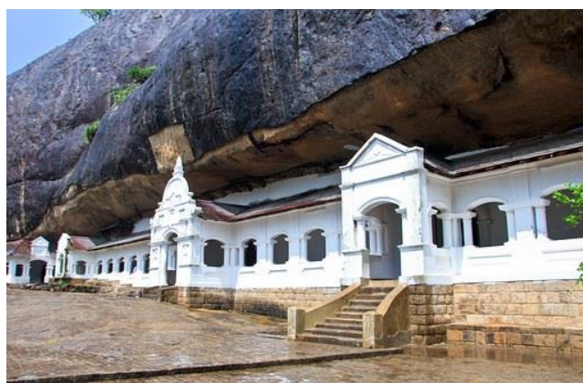
タンプツラ石窟寺院