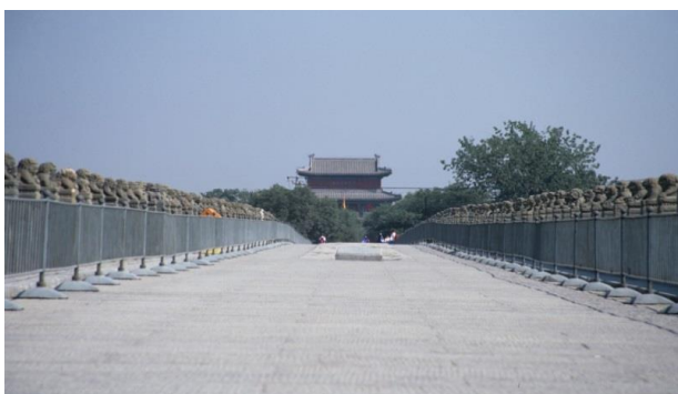
▲北京の盧溝橋

超過手荷物料金 クリーニング代、電報・電話代、心づけ、追加飲食等の個人的性質の諸費用 空港施設使用料、保安料 羽田 2,570 円 お一人部屋追加料金 42,000 円 国内における集合・解散地までの交通費・宿泊費 燃油サーチャージ 900 円（2017年1月現在） 空港税 3,170 円 渡航手続費用：旅券印紙代 傷害、疾病等に関する医療費、任意の海外旅行保険料